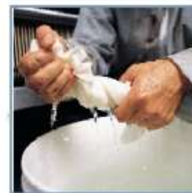
Suporta lavagens repetidas