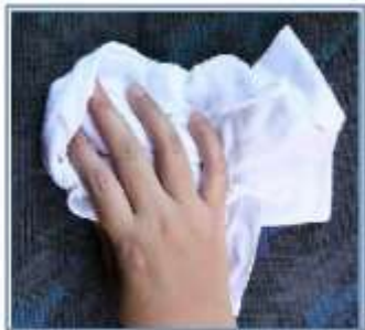
Resistente e durável