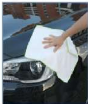
Mais Macio com cada uso