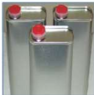
Resistente a Solventes